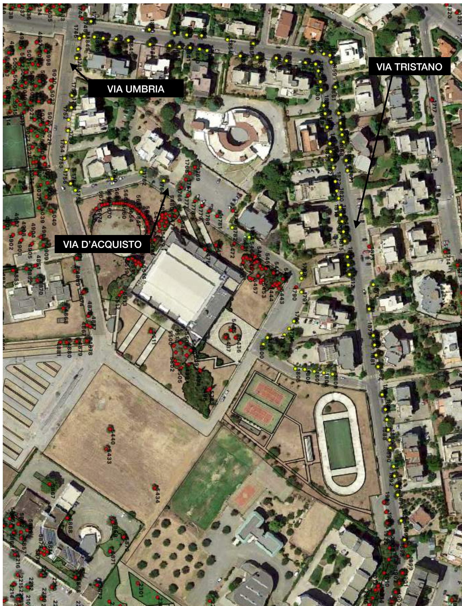
ORTOFOTO CON INDICAZIONE DEGLI ALBERI DA DELOCALIZZARE alberi da delocalizzare: indicati in giallo