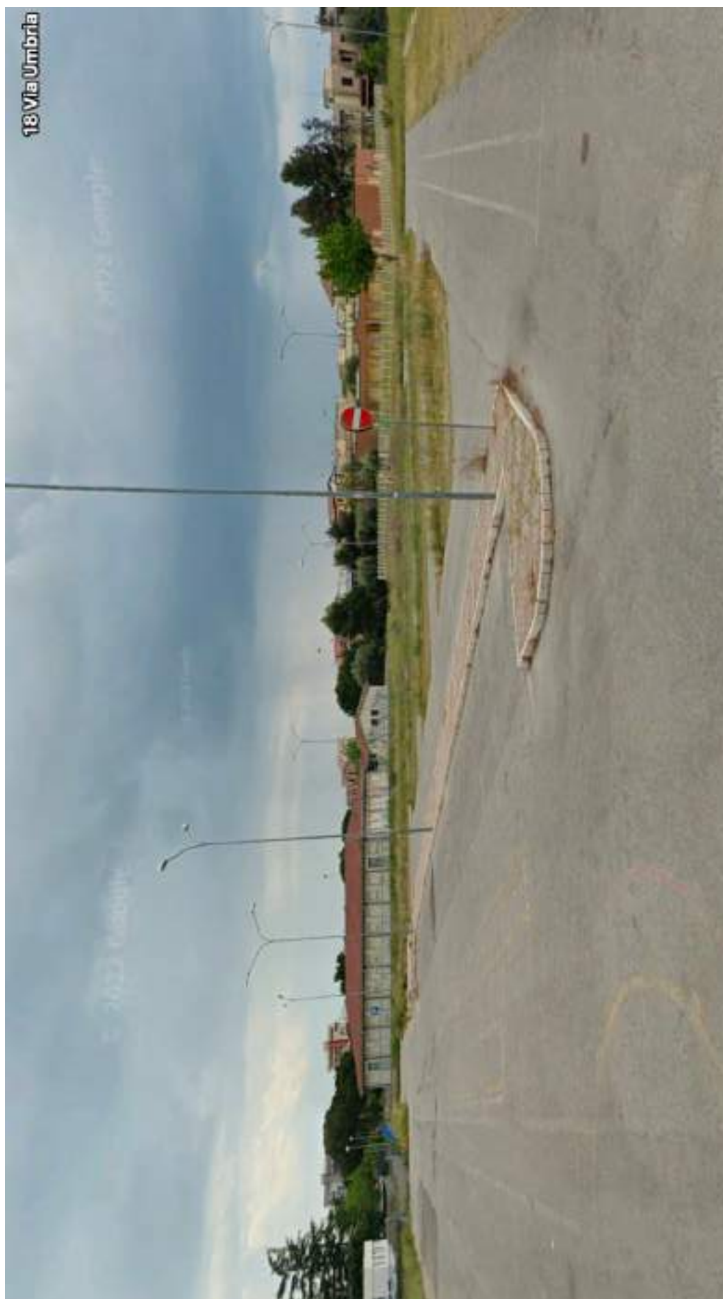
AREA DESTINATA ALLA RIPIANTUMAZIONE (parcheggio Via Umbria)